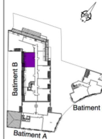
Tableau des surfaces