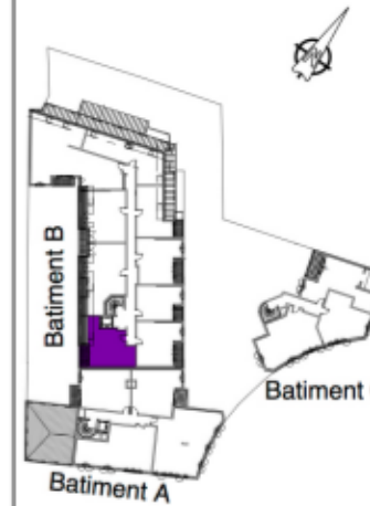
Tableau des surfaces