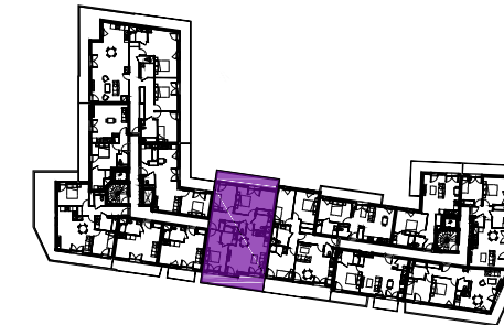
Tableau des surfaces