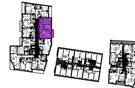
Tableau des surfaces