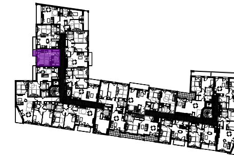
Tableau des surfaces