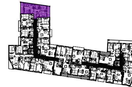
Tableau des surfaces