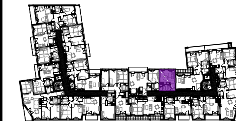
Tableau des surfaces